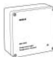
Temperaturregler Typ DR2