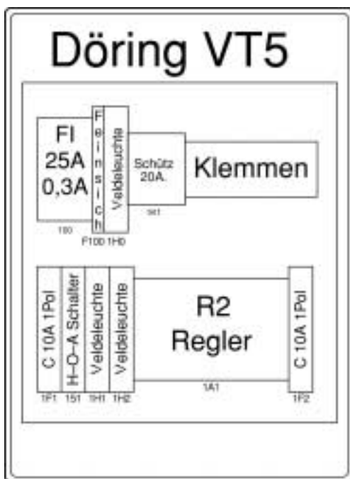
Typ VT 5

Steuereinrichtung in Klarsichtgehäuse, Schutzart IP 54 bestückt mit FI-Schutzschalter, Netz-Schalter, Umschalter für Aus-, Hand- und Automatikbetrieb, Steuerschütze, Signalleuchten, Heizkreissicherungsautomaten sowie sämtliche Klemmen für Zu- und Abgangsleitungen.